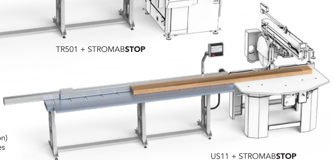
US11 + STROMABSTOP

En combinaison avec des machines à coupes simples ou combinées (rotation et/ou inclinaison) les géométries des lames ne sont pas gérées.